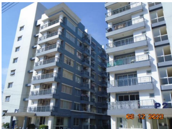
รูปที่ 1-1 สภาพโครงการในปัจจุบัน